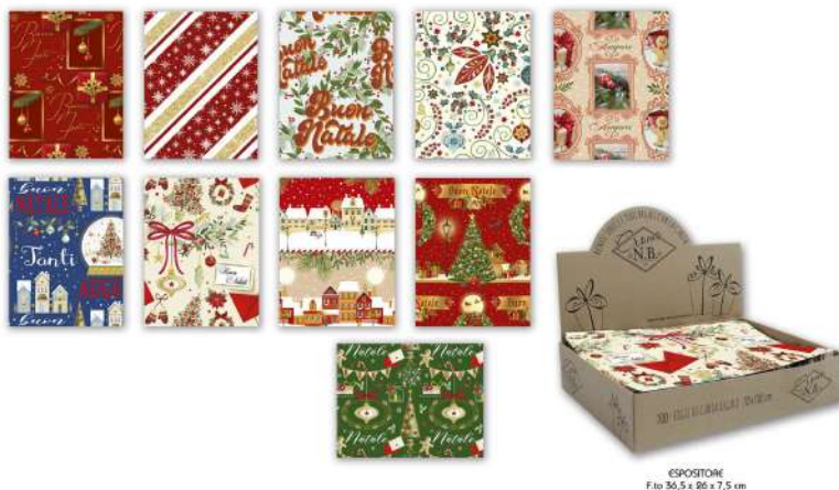
ESPOSITORE F.to 36,5 x 86 x 7,5 cm

Conf. 100 fogli cm 100x70 soggetti natalizi – cad. conf. € 37,50 + iva 22% - CodUNI GF11 - N. .... conf.