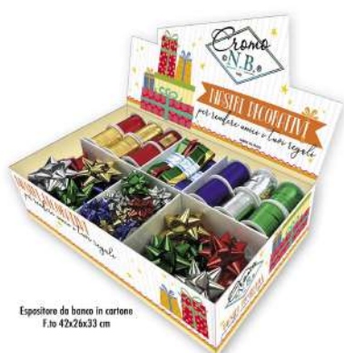
Espositore da banco in cartone F.to 42x26x33 cm

ESPOSITORE NASTRI E FIOCCHI COLORI LUCIDI